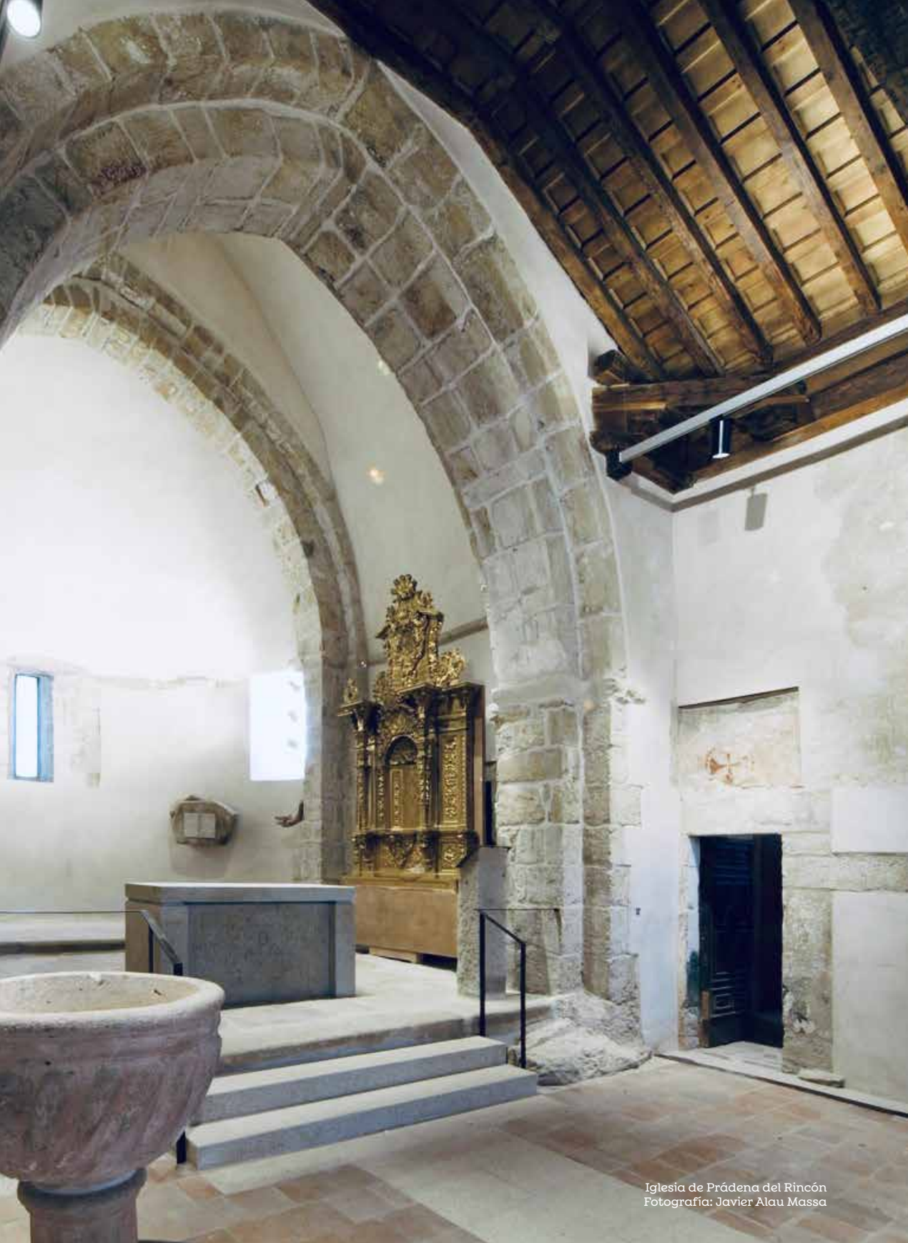
Iglesia de Prádena del Rincón